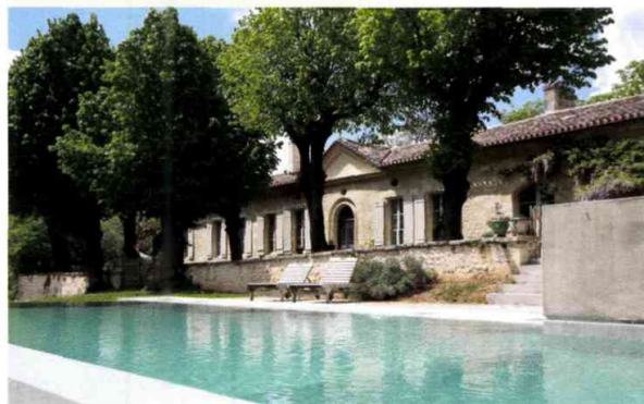
UNE CHARTREUSE DU XVIII e AUX PORTES DE BORDEAUX.

We specialise in the sale of luxury properties in the Gironde area. Our slate includes castles, typical houses, vineyards, lofts and apartments at reasonable prices. We recently sold a 18th-century house, halfway between Libourne and Bordeaux for €1m, and a pied-à-terre in Bordeaux for €730,000. The majority of our clients are foreigners, including citizens from China and the UAE. We provide them with quality services, discretion and efficiency. Our next development will certainly include rentals in beautiful houses from the area.