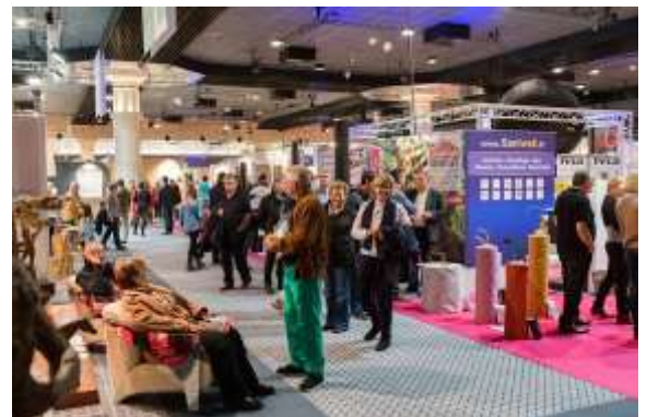
Allée centrale où plus de 10000 visiteurs passent chaque année