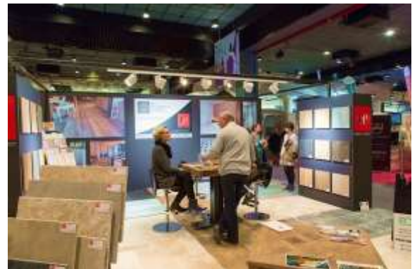
So Home Deauville : exposants revêtements sol et mur